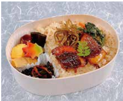
わっぱ鯛めし弁当 1,080円