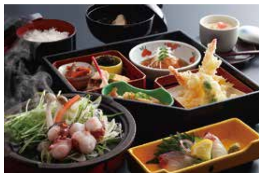
くら蔵仕出し膳 2,484円