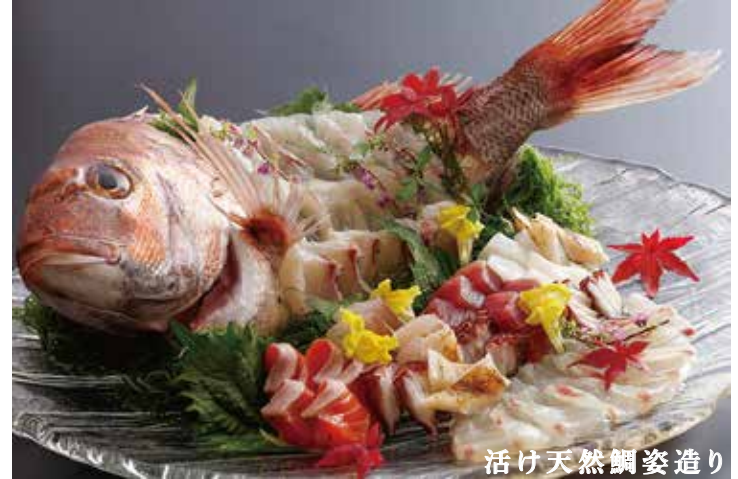
活け天然鯛姿造り