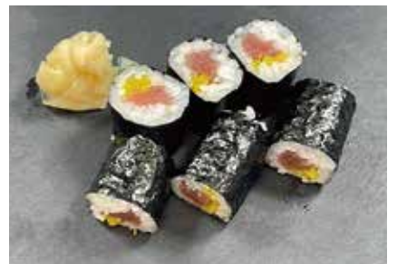
まぐろタク巻(細巻) 378円