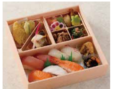
にぎり鮭弁当 2,160円 ※お茶付き