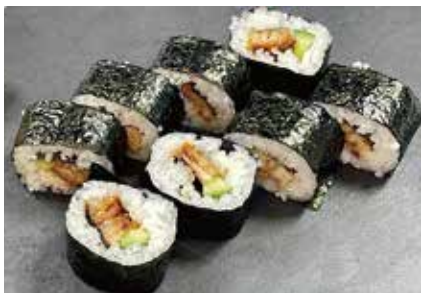
焼き穴子きゅうり巻(中巻) 540円