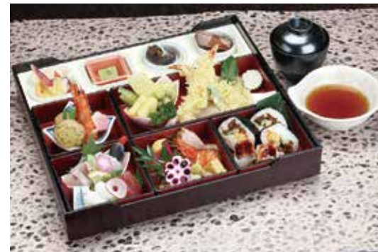
箱膳会席 いろどり (食器盛り) 5,940円 御飯物 巻き寿司六貫 穴子箱寿司・造り(4種盛り)・焼物・口取り11種・煮物6種・酢の物・小鉢二種・和牛ローストビーフ・揚物天麩羅・フルーツ四種盛り・吸物・天出汁