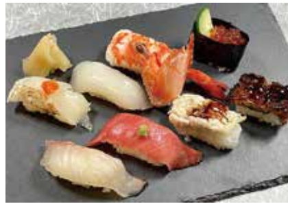
特ネタおまかせ 上にぎり八貫 2,160円