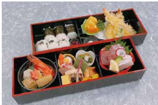
箱膳会席 かおる (食器盛り) 3,780円 御飯物 俵おにぎり・香の物・お造り(三種盛り)・小鉢二種盛り・焼物鯛塩麴焼・口取り六種・煮物六種盛り・揚物天麩羅・天出汁・吸物・フルーツ二種盛り