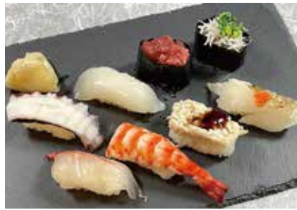
地魚おまかせにぎり八貫 1,620円