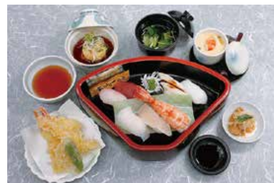
にぎり鮭仕出し膳 2,700円