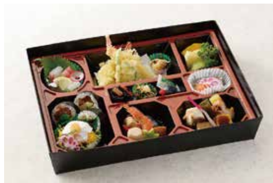
箱膳会席 いろは (簡易バック) 4,860円 造り四種盛り・酢の物・煮物六種・和え物二種・揚物天麩羅・焼物鯛塩麴焼・口取り九種・御飯物 巻寿司三貫・鯛散らし寿司・フルーツ三種盛り