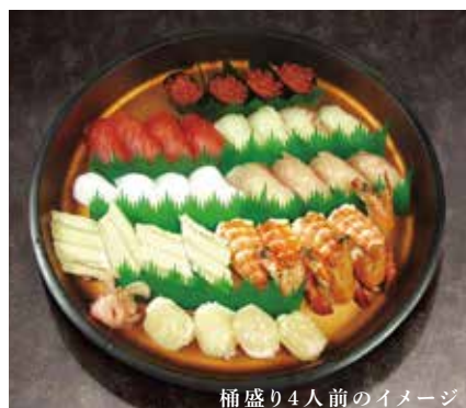
桶盛り4人前のイメージ