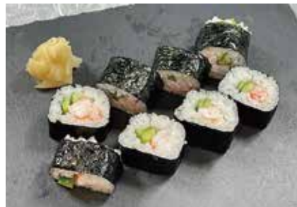
海老きゅうり巻(中巻) 648円