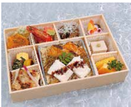
極上穴子と鯛弁当 2,700円 ※お茶付き