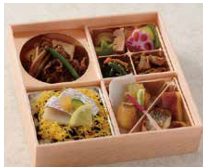
和風弁当 かなで 2,160円 ※お茶付き