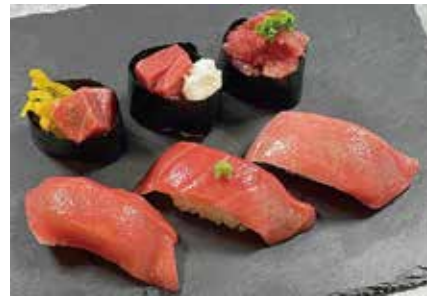
本まぐろ六貫盛り 1,728円