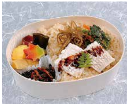
わっぱ穴子めし弁当 1,080円