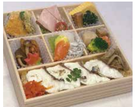
焼きしゃぶ鯛弁当 1,620円 ※お茶付き