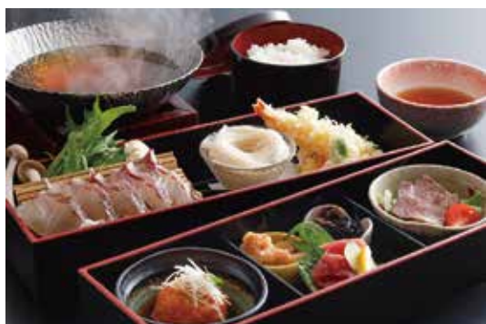
鯛出汁しゃぶ彩り仕出し膳 2,484円