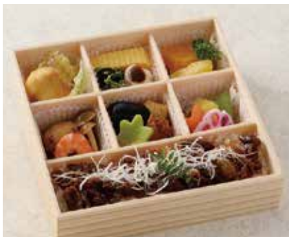
国産牛しぐれ煮弁当 1,944円 ※お茶付き