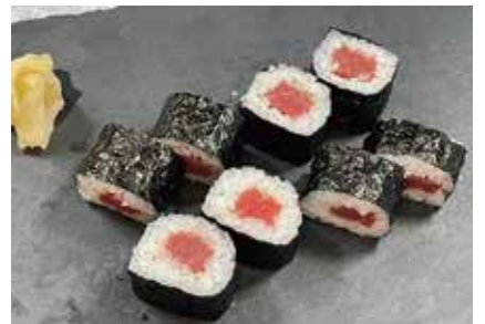
本まぐろ鉄火巻(中巻) 1,080円