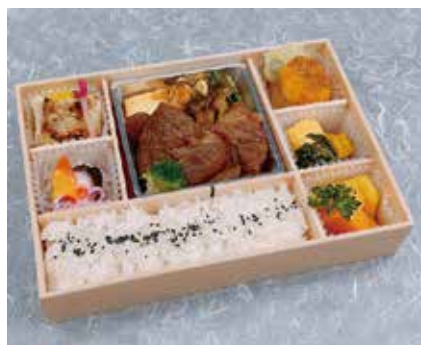
和牛すき焼き弁当 2,700円 ※お茶付き