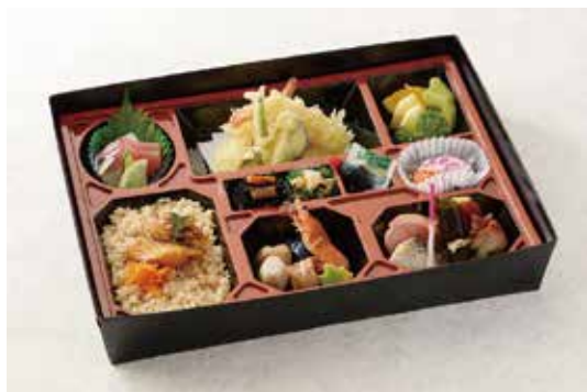
箱膳会席 さくら (簡易バック) 3,780円 お造り三種盛り・酢の物・煮物六種・和え物二種・揚物天麩羅・焼物鯛塩麴焼・口取り六種・御飯物 鯛めし・フルーツ三種盛り