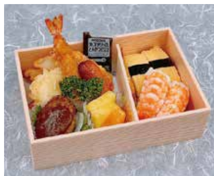
お子様弁当(幼児向け) 1,080円