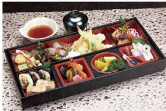
箱膳会席 いこい (食器盛り) 4,860円 御飯物 巻寿司三貫 海老箱寿司二貫・造り(三種盛り)・酢の物・小鉢二種・焼物鯛塩麴焼・口取り11種・和牛ローストビーフ・揚物天麩羅・煮物6種・フルーツ3種盛り・吸物・天出汁