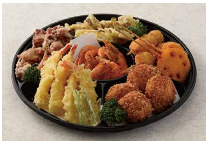
揚物オードブル 4,860円