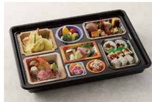
箱膳会席 こはる (簡易バック) 5,940円 造り四種盛り・酢の物・煮物六種盛り・強肴 和牛ローストビーフ・焼物 鯛塩麴焼・口取り11種・御飯物 鯛箱寿司 煮穴子箱寿司 巻寿司二貫・フルーツ四種盛り