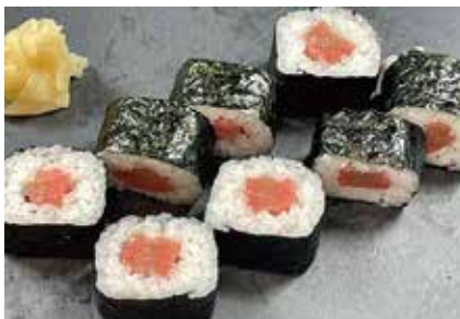
本まぐろトロ 鉄火巻(中巻) 1,944円