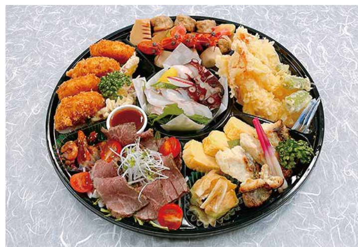
彩りオードブル 5,940円

※お届けは玄関先で、お料理類は番重などにまとめて入れてのお渡しとなります。 ※配膳はお客様でお願いいたします。 ※容器の返却は事前確認させていただきます。