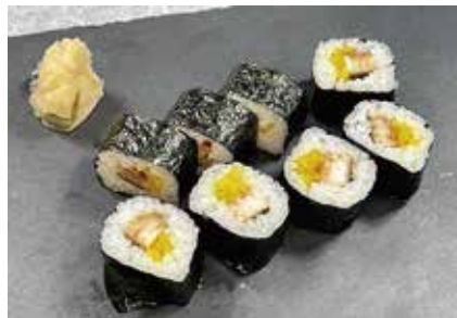
焼き穴子しんこ巻(中巻) 648円