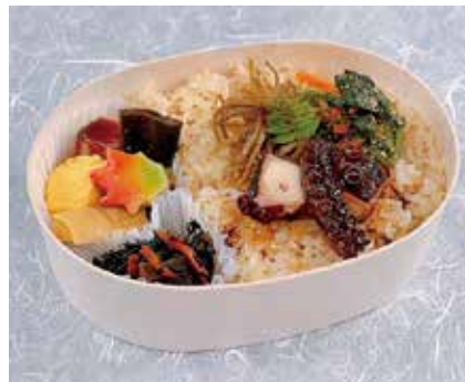
わっぱタコめし弁当 1,080円