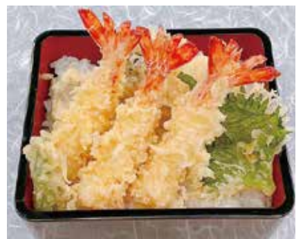
車海老天ぷら重 2,376円