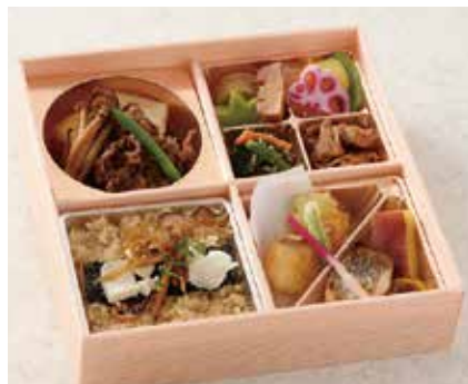
和風弁当 あかり 2,160円 ※お茶付き