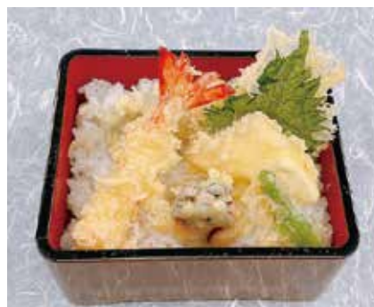
車海老と地魚天ぷら重 1,620円