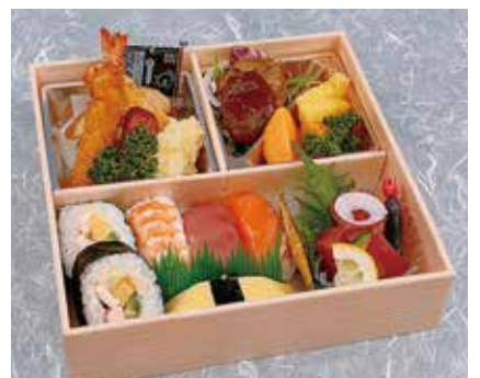
お子様弁当(小学生向け) 1,620円